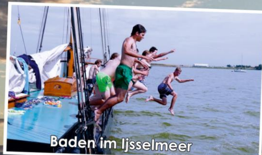
Baden im Ijsselmeer